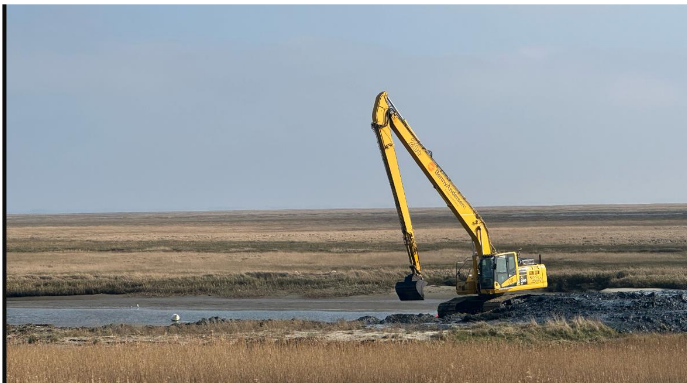
Figur 2 Oprensning og udretning af hjørner i gang

En fredag og lørdag i marts kom vores faste samarbejdspartner forbi og oprensede svejbassinet ligesom der blev taget godt af de 2 hjørner for at prøve at lave en større vandgennemstrømning til bassinet.