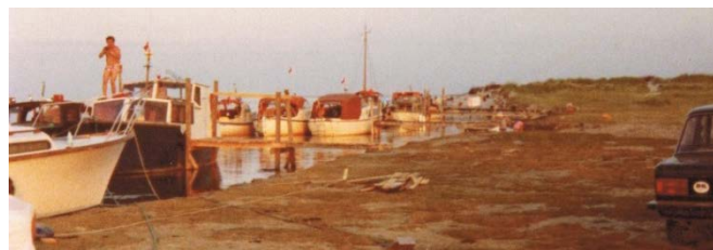
Figur 5: Ribebåde ved Hønen i 1970erne