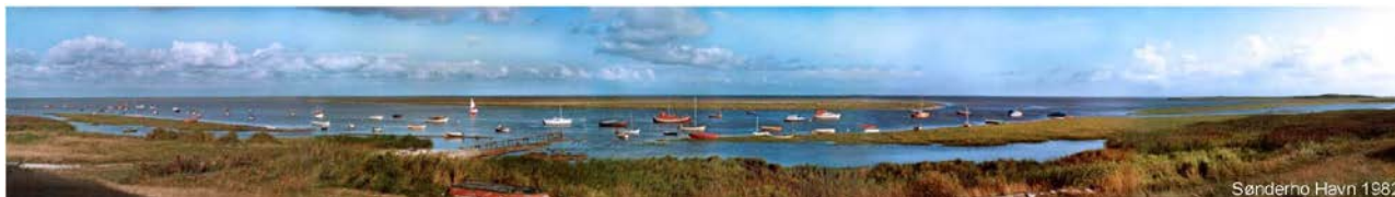
Sønderho Havn 1982. Bådene ligger for svaj i tidevandsrenden Dybet.

I rapportens afsnit 2 beskrives den historiske baggrund for Fanøs transformation fra søfart til oplevelsesturisme. I afsnit 3 beskrives de turistmæssige og erhvervsmæssige konsekvenser af at området er blevet nationalpark og verdensnaturarv. I afsnit 4 beregnes de rekreative værdier af projektet det Maritime Sønderho.