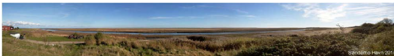
Sønderho Havn 2010. Tidevandsrenden Dybet er næsten sandet til.