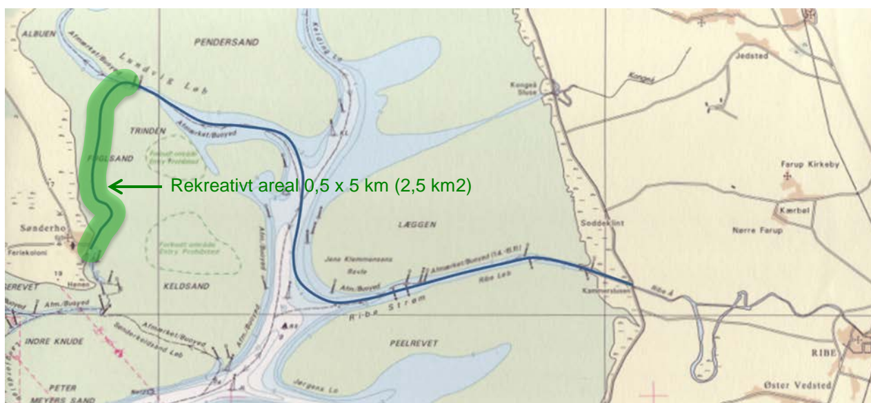
Figur 6: Slagters Lo vil give adgang til naturoplevelser i et 2,5 km 2 (250 ha) stort område

Slagters Lo vil give adgang til naturoplevelser hidrørende fra et 5000 ha stort området ( Figur 6 ) øst for Sønderho. Det er et unikt område, der i 2014 blev udpeget som Verdensnaturarv. Det kan derfor antages, at den rekreative naturværdi af området, vil få en betydeligt højere værdi end gennemsnittet.