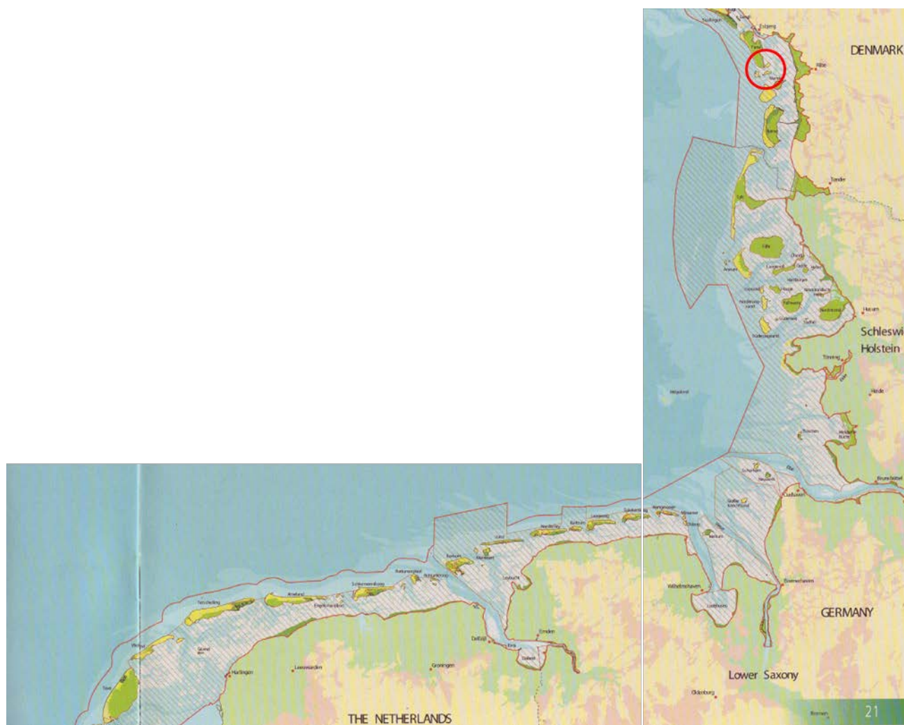
Figur 4: Det trilaterale Vadehavsområde, Danmark, Tyskland og Holland

I det hollandske Vadehav kan man opleve tusinder af gæster, der ofte i store traditionelle skibstyper – nu indrettet til passagerer – sejler fra ø til ø, og bibringer disse øer liv og dynamik. Både i Tyskland og i Holland sejler man fra havn til havn, besøger hinanden og udveksler historier og oplevelser, men der er kun sjældne besøg af disse skibe i det danske Vadehav. Da det kun er muligt at anløbe Esbjerg, Havneby og Nordby, mens de gamle søfartsbyer som Varde, Hjerting, Ribe, Højer og Tønder i dag alle er vanskelige eller umulige at besøge på grund af inddigninger og lave vejbroer. Når Slagters Lo oprenses kan Sønderho anløbes af everter, kuffer og andre mindre både, dette vil hurtigt rygtes i det frisiske område. Sejlere med traditionelle skibe får dermed en ny mulighed, for også at inddrage det danske vadehav i deres sejladsområde.