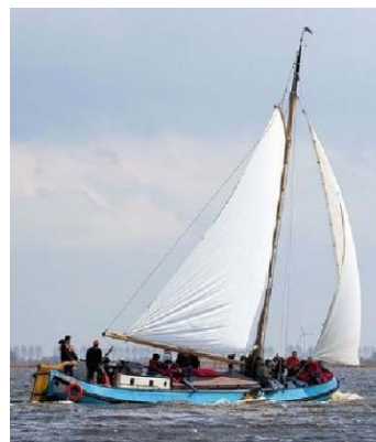
Figur 3: Traditionelle skibe (everter) i Vadehavet

Den traditionelle skibstype, evert med sidesværd og flad bund, er velegnet til sejlads i Vadehavet, Rebekka af Fanø ligger i Nordby og foretager ofte sejlads rundt Fanø, men kan ikke for tiden anløbe Sønderho, det vil hun kunne efter oprensningen af Slagters Lo.