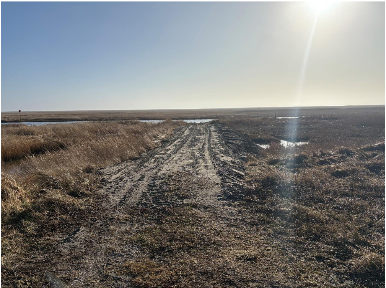
Slæbestedet nede ved nord en smuk vinterdag efter tilføjelsen af sandet fra Råbjerg Mile

”Råbjerg Mile” er ny flyttet og sandet er brugt til at bringe slæbestedet nede ved nord tilbage til et brugbart niveau.