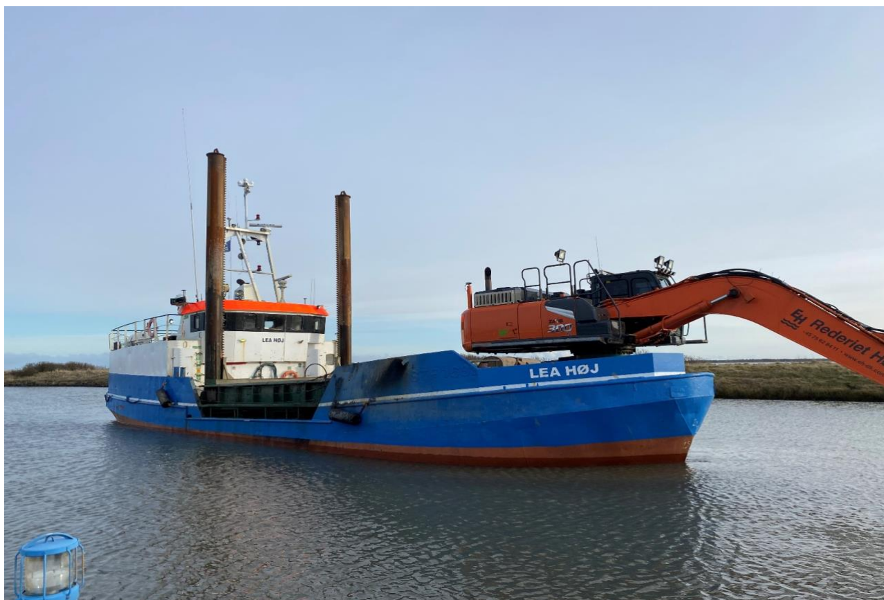
M/V Lea Høj i havnen i Nordby den 19.2.2023